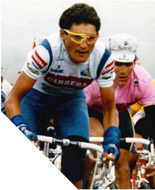
In foto: Claudio Chiappucci in azione al Giro d'Italia del 1992