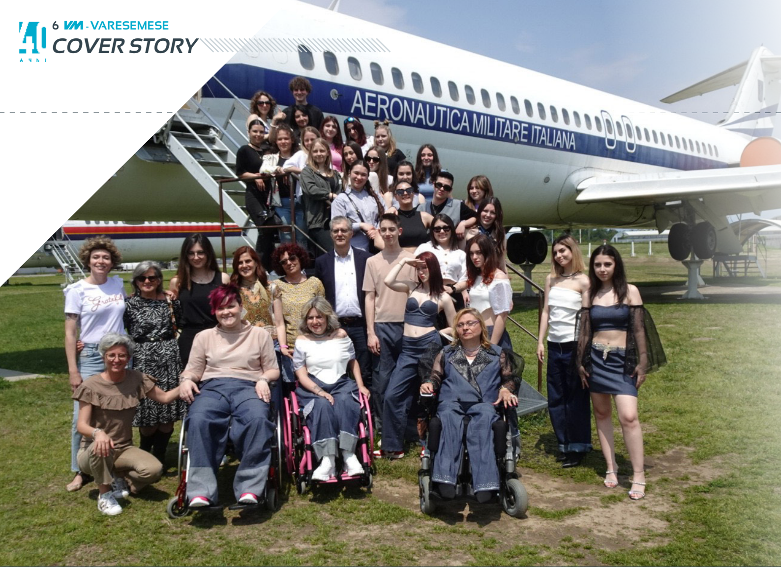
Il progetto Diritto all'eleganza con le modelle all'Acof e a Volandia